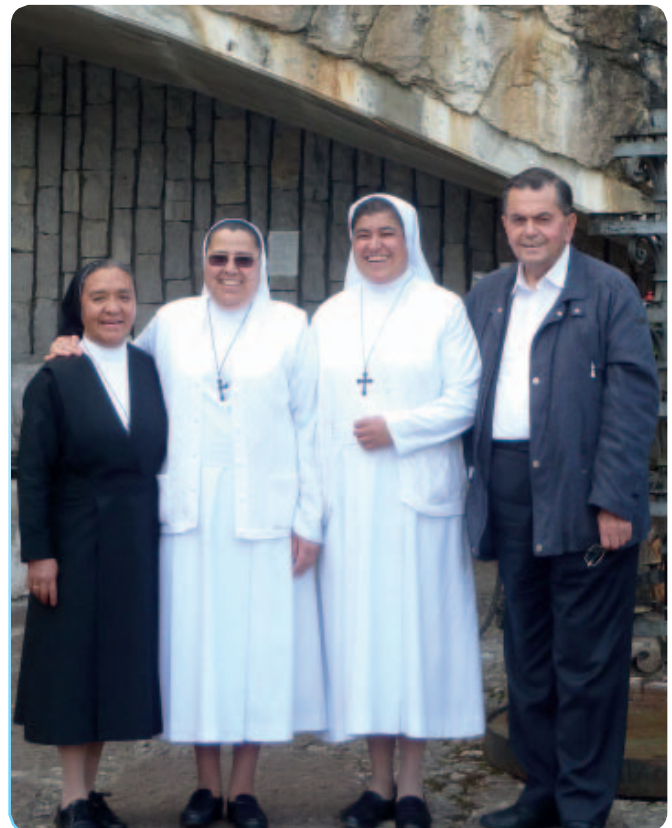
Suor Isabel con la Madre Vicaria, la Madre generale e don Sirio