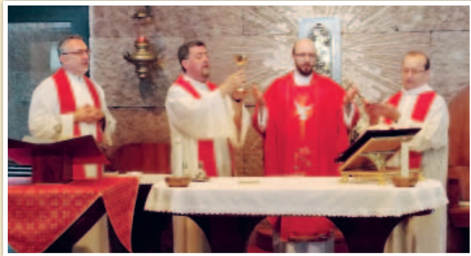
25 luglio 2018. I frati cappuccini