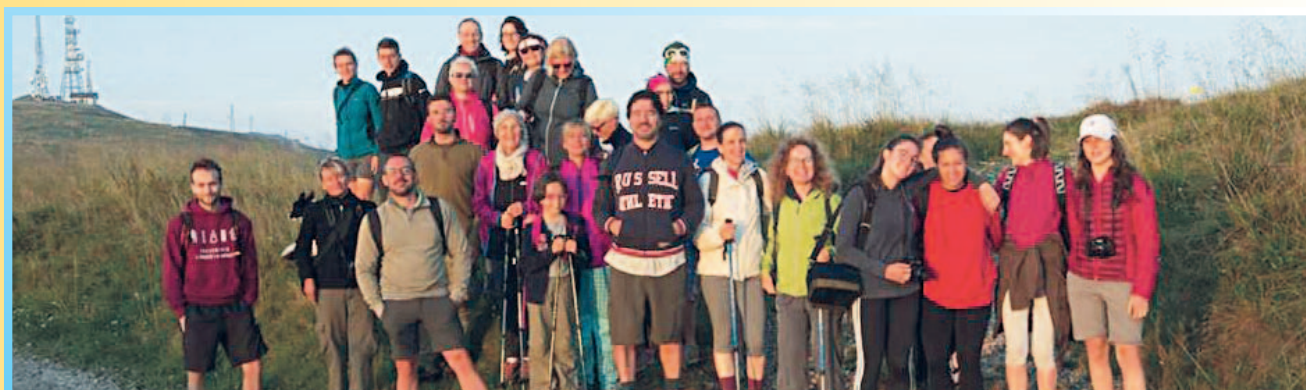
Passeggiata all'alba organizzata dall'Associazione Amici del Nevegàl l'8 agosto