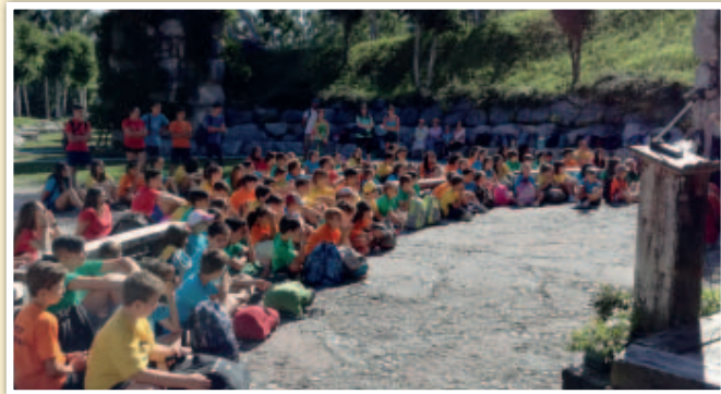
19 luglio 2018. Grest di Castello Roganzuolo