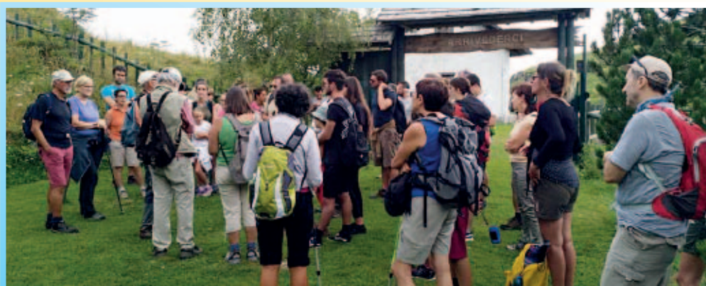
Passeggiata con Visita all'Orto Botanico organizzata dagli Amici del Nevegàl