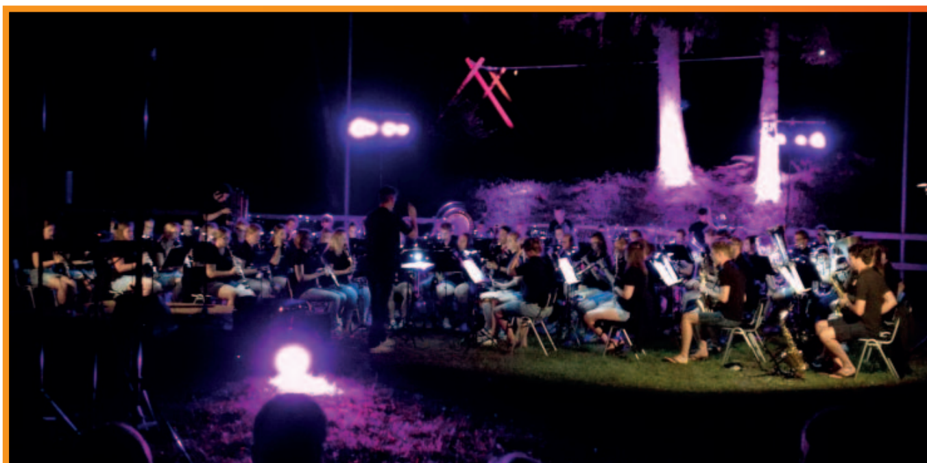
L'orchestra sinfonica di fiati dei giovani olandesi

Il ritorno del lupo e dei grandi carnivori è stato un altro tema sentito nell'estate del Colle. Un incontro con l'esperto naturalista Giuseppe Tormen e una mostra fotografica al Centro Le Torri organizzate dal Comune di Belluno hanno dato modo di spiegare questo fenomeno dal punto di vista faunistico, suscitando interesse e partecipazione.