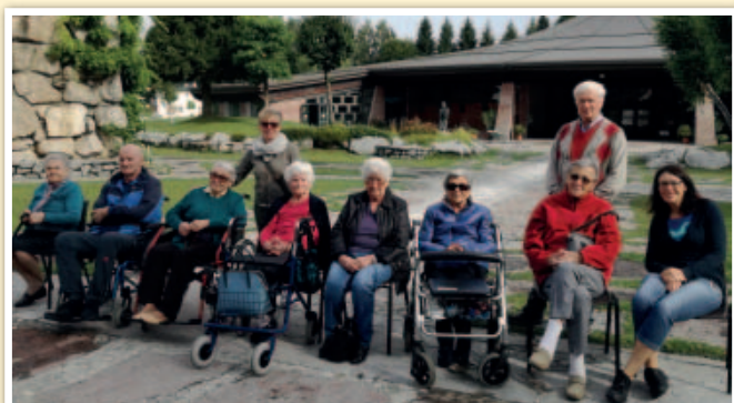
7 settembre 2018. Anziani della Casa di riposo di Santa Croce al Lago