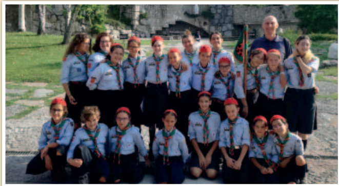
7 agosto 2018. Volo estivo delle coccinelle di Treviso