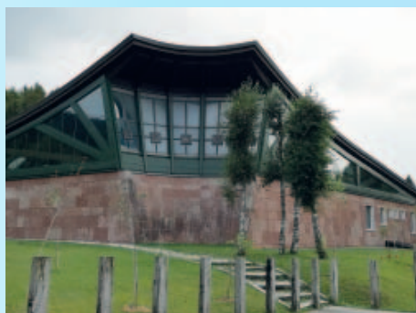
Betulle davanti al Santuario