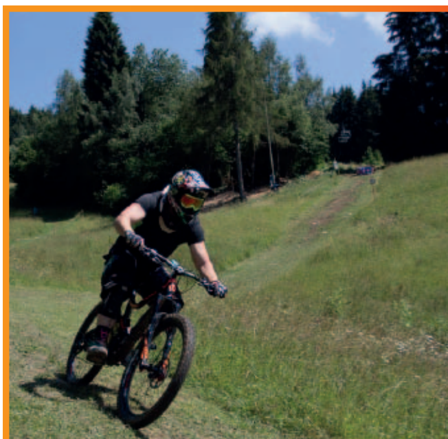
Down hill mountain bike sui percorsi del bike park del Nevegal

nomia e delle passeggiate due appuntamenti tra i rifugi e i ristoranti del Nevegal con "1 formaggi sul Colle" domenica 1 luglio e "Cicheti in Cresta" sabato 25 agosto.