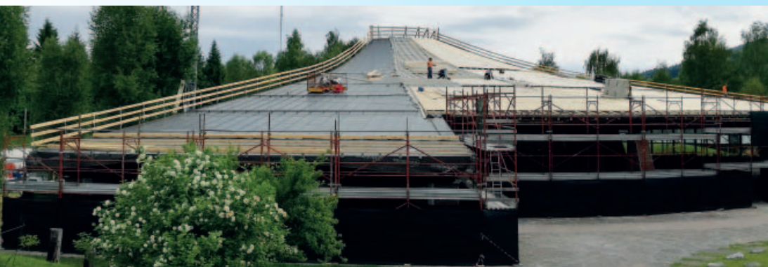
Lavori sul tetto

Una struttura complessa come è il Santuario richiede una continua manutenzione