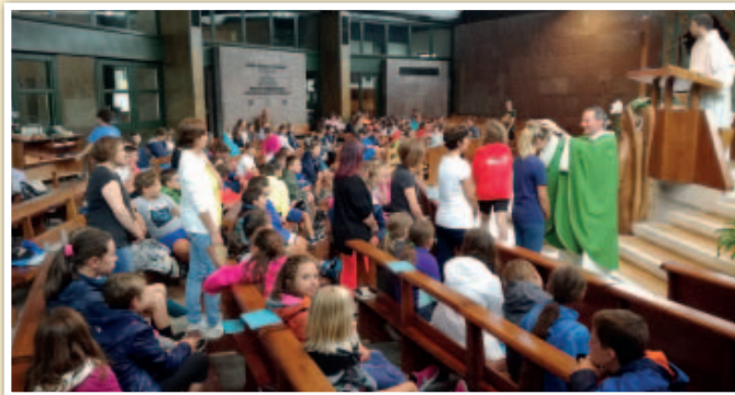
20 luglio 2018. Campo estivo di Tombelle